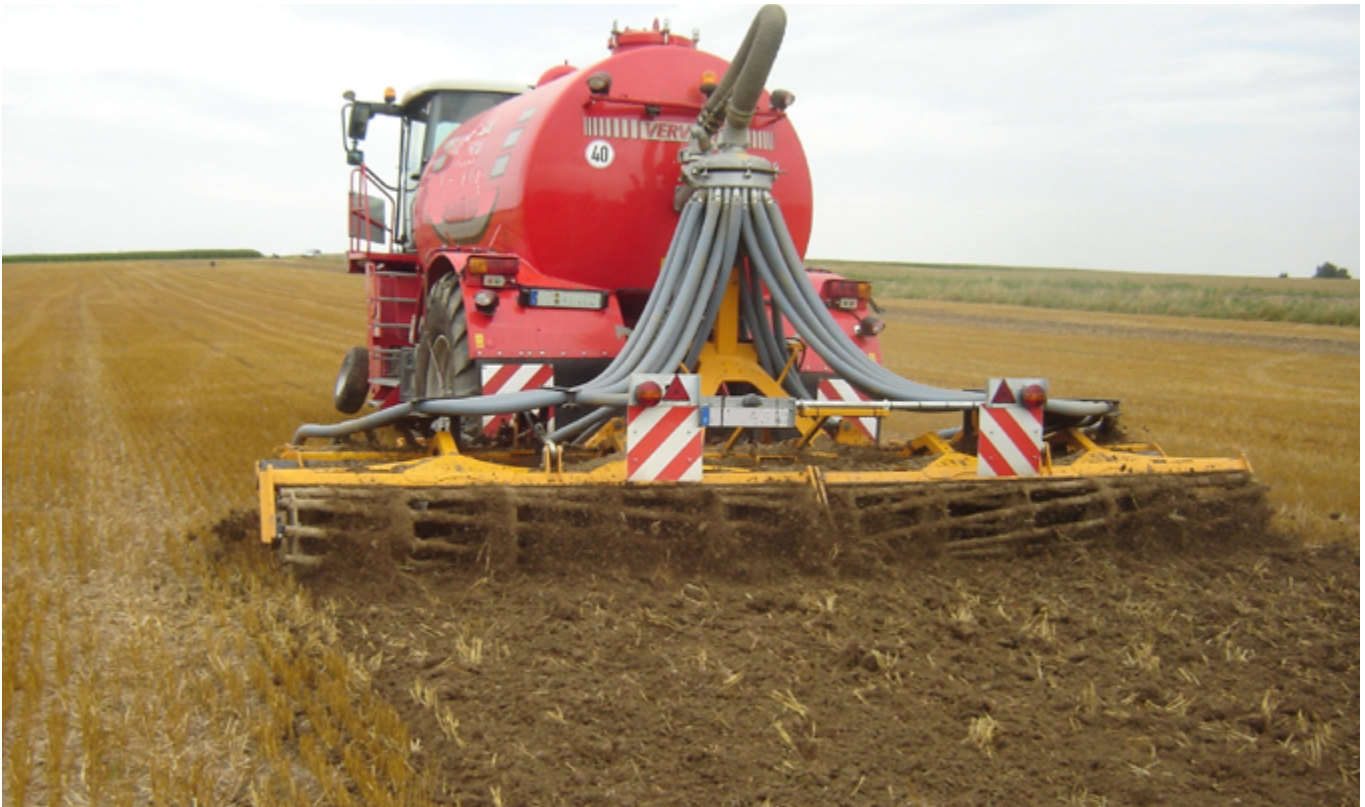
Verlustarme Gülleaufbringung durch direkte Einarbeitung