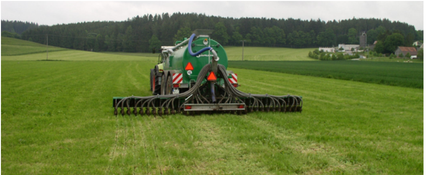
Verlustarme Gülleaufbringung mit einem Injektionsverfahren

Verordnung über die Anwendung von Düngemitteln, Bodenhilfsstoffen, Kultursubstraten und Pflanzenhilfsmitteln nach den Grundsätzen der guten fachlichen Praxis beim Düngen (Düngeverordnung–DüV) vom 26. Mai 2017, BGBl. I 2017, Nr. 32, S. 1305–1348