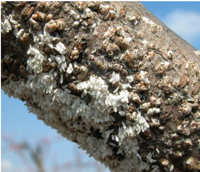
Befall mit männlichen Tieren