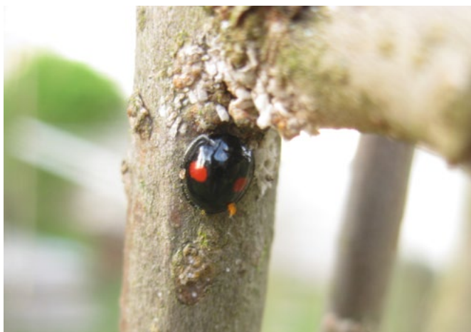
Chilocorus renipustulatus in Maulbeerschildlauskolonie am Morus sp.

der Zehrwespenarten Aphytis sp. und Encarsia sp. ernähren sich von Nektar. Für die Eireifung brauchen sie eiweißreiche Nahrung, die sie durch das sogenannte „host-feeding“ erhalten. Beim „host-feeding“ werden Maulbeerschildläuse angestochen und die austretende Hämolymphe als Nahrung aufgenommen. Zum Teil wird das „host-feeding“ mit der Eiablage gekoppelt, wodurch ein Teil der Schildläuse abstirbt.