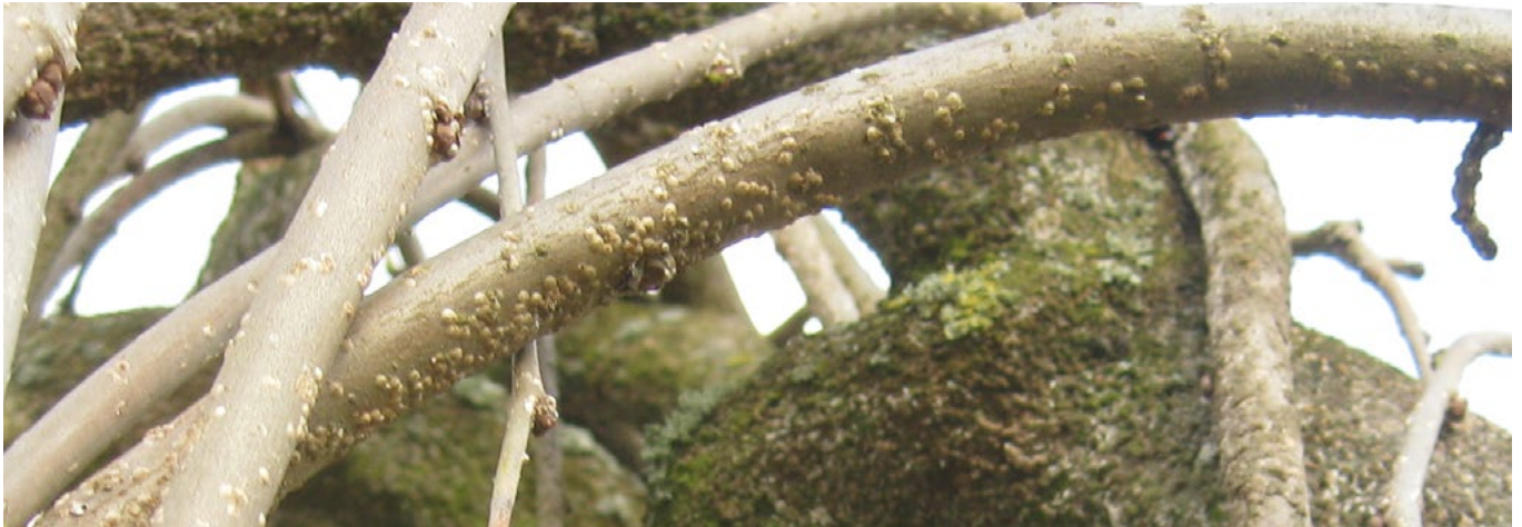
Befall mit weiblichen Tieren der Maulbeerschildlaus ( Pseudaulacaspis pentagona ) an Maulbeere ( Morus sp. )